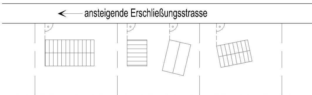
System – Skizze / „Lage des unteren Bezugspunktes“

Oberer Bezugspunkt: Für die Traufhöhe: Außenkante der Dachhaut im Schnittpunkt mit der Außenkante der Außenwand, für die Firsthöhe: Oberkante der Dachhaut im First; siehe System-Skizze „Bebauung“